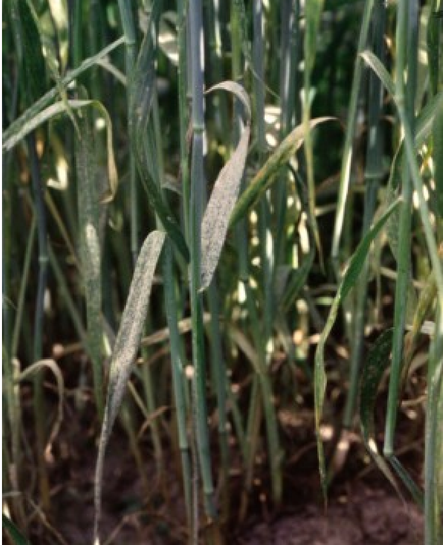
Billede 1. Meldug i rug.